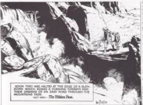
SOON THEY ARE HURLED AT THE EDGE OF A GLEN, DOWN WHICH ROLLS A FORMIDABLE TORSION AND THEIR DREAMS OF AN EARLY MORN THROUGH THE MOUNTAINS FADE. -The Hidden Pass.