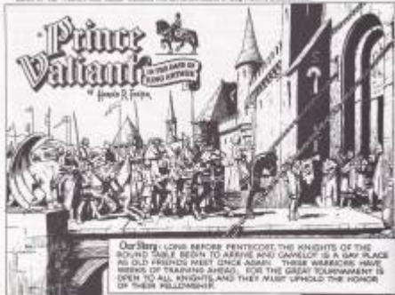
Our Story: LONG BEFORE PENTECOST, THE KNIGHTS OF THE ROUND TABLE BEGAN TO ARRIVE AND GAMBOLE IN A GAP PLACE OF OLD BRITAIN. FIRST CAME AGONY. THESE WARRIOR MEN OF TRAINING AHEAD. FOR THE GREAT TOURNAMENT IS OPEN TO ALL KNIGHTS AND THEY MUST UNFOLD THE HONOR OF THEIR WILDMANSHIP.