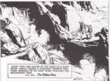
SOON THEY ARE HELD AT THE EDGE OF A GLEN, DOWN WHICH ROLLS A FOAMING TORRENT, AND THEIR DREAMS OF AN EARLY HOME THROUGH THE MOUNTAINS FADE. —The Hidden Pass.