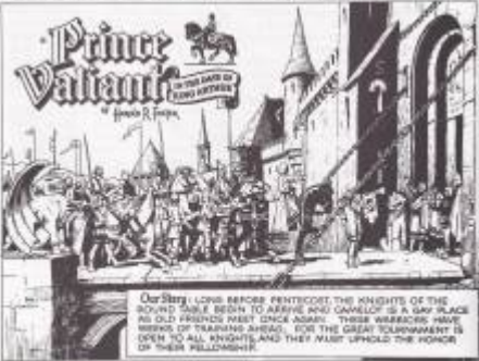
Our Story: LONG BEFORE PENTECOST, THE KNIGHTS OF THE ROUND TABLE BEGAN TO ARRIVE AND GALLEY IS A GAP PLACE FOR OLD FASHIONED CHIVALRY. THESE WARRIOR MEN OF TRAINING AHEAD, FOR THE GREAT TOURNAMENT IS OPEN TO ALL KNIGHTS AND THEY MUST UNFOLD THE HONOR OF THEIR FELLOWSHIP.

could be getting from the downtown Chicago hotel where my family was staying to this suburban bedroom community. I needed a car for the trip to Evanston and took a taxi to their home. Helen and Hal were like little kids, making me feel much at home, although they had never laid eyes on the young stranger from Washington, D.C. I remember Foster at length about the way he worked, and he kindly brought out his notebooks where he had carefully laid out sequences of Val in detailed sketches. From this notebook he transcribed the text and drawings to the book's drawing board, usually breaking up his pages into sheets so that they would fit comfortably on the drawing board. I asked him for an original Sunday page, and I recall his comment, "I keep my original for book reproduction," he said, "but if you ever get into the business, I will