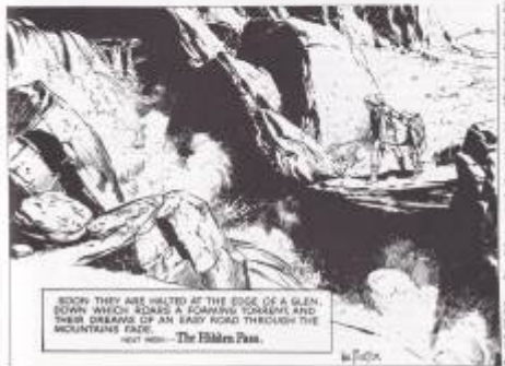
SOON THEY ARE HURLED AT THE EDGE OF A GLEN, DOWN WHICH ROLLS A FOAMING TORRENT, AND THEIR DREAMS OF AN EASY ROAD THROUGH THE MOUNTAINS FADE. —The Hidden Pass.