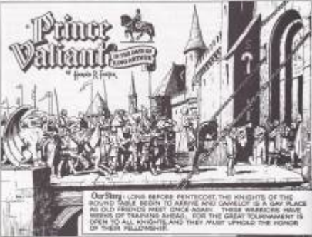
Our Story: LONG BEFORE PENTECOST, THE KNIGHTS OF THE ROUND TABLE BEGAN TO ARRIVE AND GALLEY IS A GAP PLACE TO OLD FRENCH PEASANT CUCKY AGAIN. THESE WARRIORS HAVE WORDS OF TRAINING AHEAD. FOR THE GREAT TOURNAMENT IS OPEN TO ALL KNIGHTS AND THEY MUST UNFOLD THE HONOR OF THEIR WILDMANSHIP.