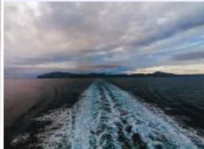
Bild 2: Die Insel Amorgos wie man sie von der Fähre aus sieht, Blickrichtung aus Nordwest nach Südost.