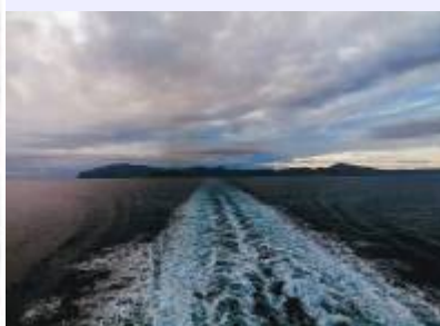
Bild 2: Die Insel Amorgos wie man sie von der Fähre aus sieht, Blickrichtung aus Nordwest nach Südost.