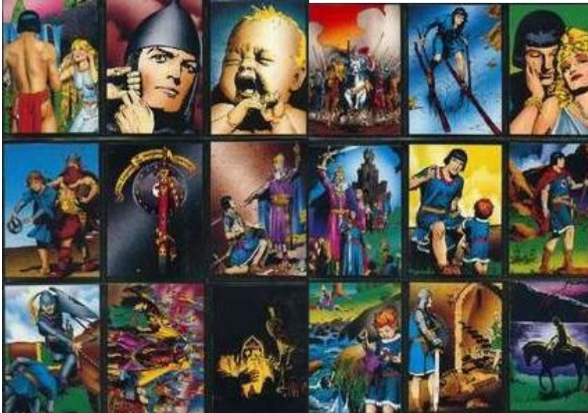
Abb.2: Sammelkarten (Auszug)