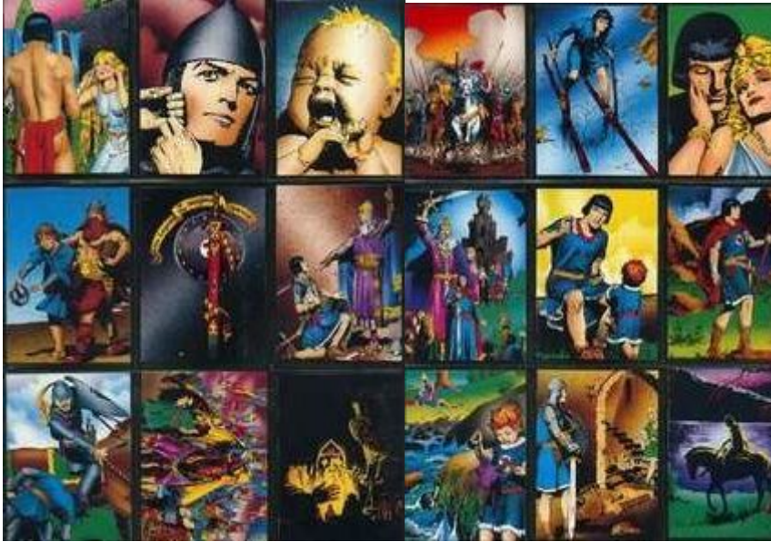
Abb.2: Sammelkarten (Auszug)

sowie eine kleine s/w Abbildung der selben Seite. Was für Liebhaber (wie mich!)