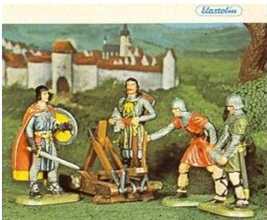
Abb. 5: Prinz Eisenherz und Gawain aus einem Hauser Elastolin-Katalog