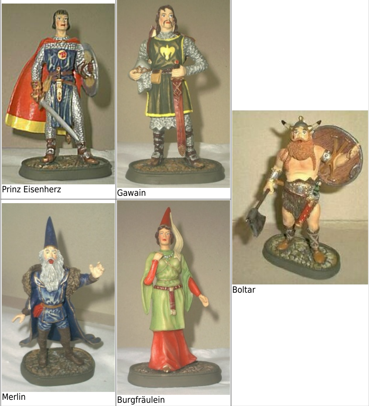
Abb. 7: fünf Figuren einer von Bulls, Kings Features Syndicate, herausgegebenen Sonderserie. Jede Figur ist ca. 14 cm hoch und auf 120 Kopien limitiert. Zumindest die Eisenherz-Figur ist ein Abguß vom Modell des Chefmodelleurs Weißbrodt der Firma Hausser. Infos bei Fanseite Elastolin/Hausser .

Basisinformationen habe ich im Artikel Elastolinfiguren zusammengestellt. Allerdings werde ich dieses Thema nicht weiterverfolgen!