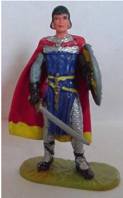
Abb.8: Prinz Eisenherz in Elastolin