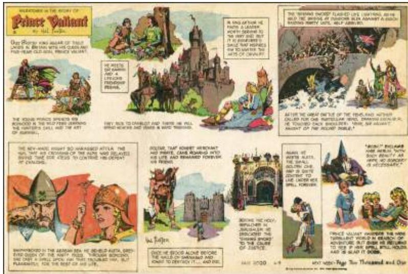
Abb.6: Sonntagsseite 2.000 vom 8.6.1975